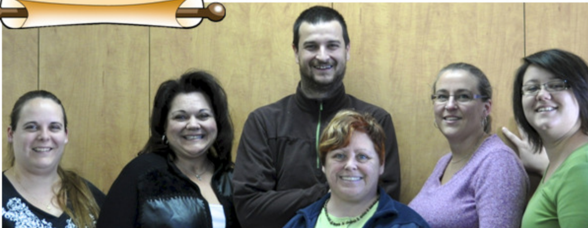
Les membres du comité des partenaires

Ne manquez pas le prochain épisode bientôt.