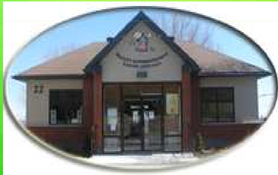
Maison communautaire Daniel-Johnson

Deux communautés Deux histoires La même réussite!